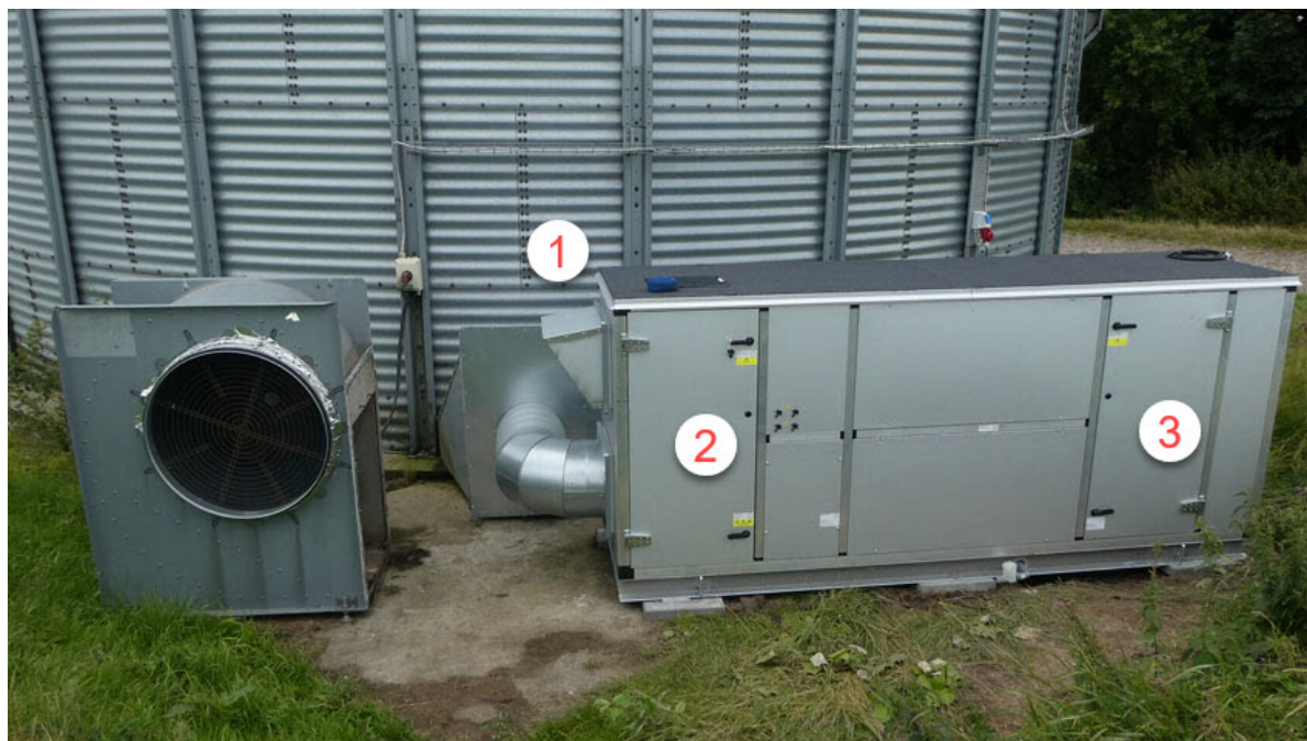
Billede 2. Ved monteringen erstattes stålsiloens 15 kW blæser og 80 kW oliebrænder med JAtrock enheden.

Det testede tørringssystem anvender et nyt tørringskoncept, hvor grundprincipper er, at indgangsluften tørres med traditionel køleteknik. Som ved tilsætning af varme øger det den mængde fugt, hver kubikmeter luft kan bære ud af afgrøden. Desuden anvender en meget mindre blæser.