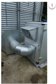
Billede 3. Enheden koblet på silo.