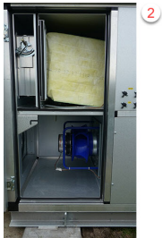
Billede 4. Filter og blæser.