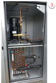
Billede 5. Køleanlæg.