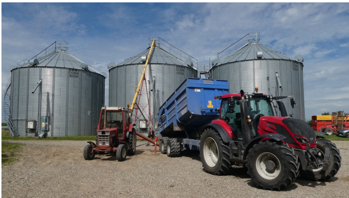
Billede 6. JAtrock blev testet på en af de tre stålsiloer på hver 536 m 3 .

JAtrock enheden blev monteret på silo 1. Der blev monteret måleudstyr både på silo 1 (JAtrock) og silo 2 (traditionel). Silo 3 var ikke en del af testen. Der blev målt: